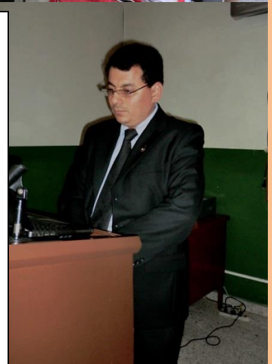
Autoridades presentan rendición de cuentas, periodo 2011-2012.