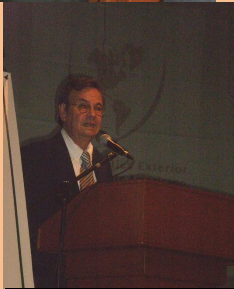
Conferencista. Sede diplomática de México