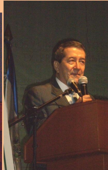
Conferencistas. Embajadores de Chile y Colombia