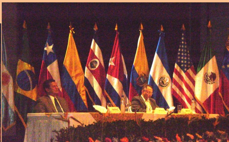
Conferencistas. De izq. a dcha. Ministro de Relaciones Exteriores, Canciller Hugo Martínez, y el Embajador de Cuba