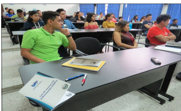
Seminario Gobierno Abierto y Globalización

El Seminario será clausurado por las Autoridades el próximo 16 de marzo.