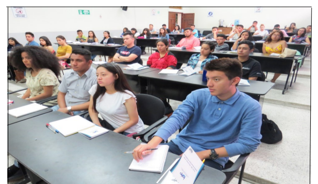
Estudiantes de CC.JJ. y RR.II.