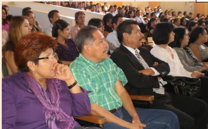
Facilitadores. Jueces de la República impartieron los Diplomados