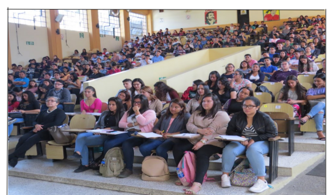
Estudiantes de Nuevo Ingreso