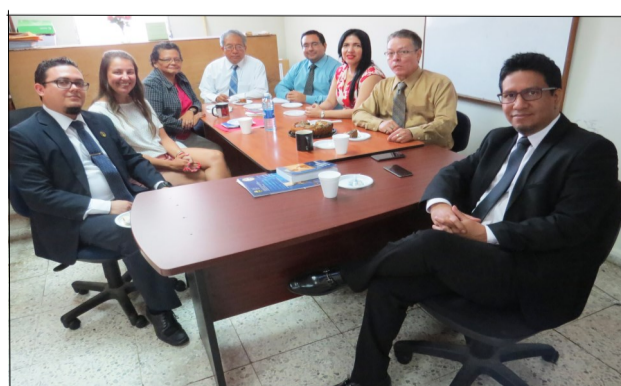
Profesores de CC.PP. se reúnen con la Dra.