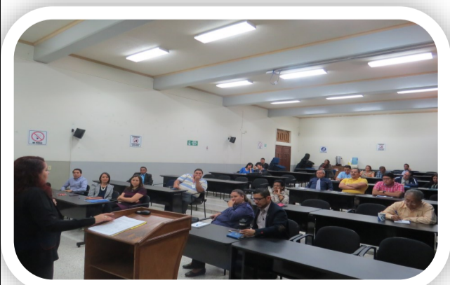
Decana de la Facultad dirige la Asamblea con la asistencia de jefaturas y unidades