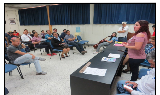
Decana de la Facultad, se dirige a asistentes