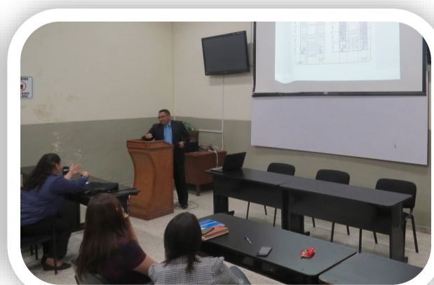
La Unidad de Proyección Social será beneficiada con la implementación del Proyecto