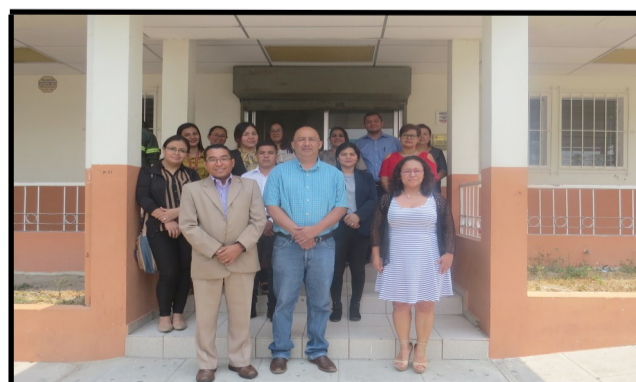
Delegación de estudiantes junto a alcalde