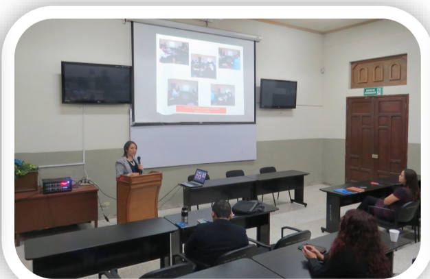
Unidad de Investigación presenta el Proyecto para creación del Instituto de Investigación