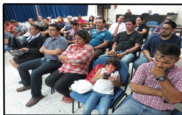
Representantes de organizaciones sindicales