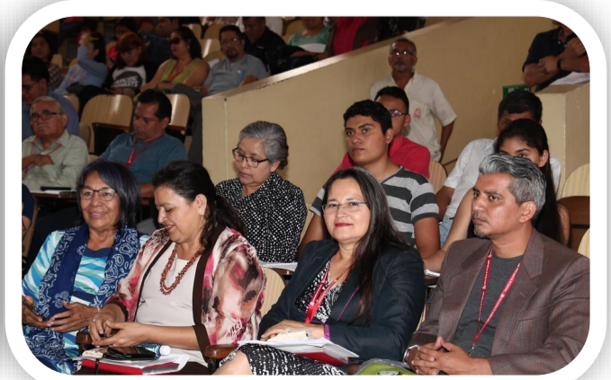
Autoridades de la AGU y conferencistas acompañan las diversas ponencias