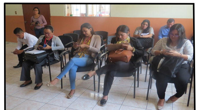
Estudiantes de CC.JJ. y RR.II.