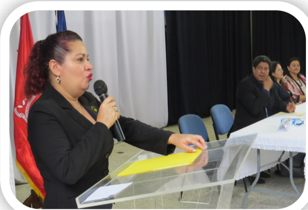
Decana de la Facultad da palabras inaugurales en la Cuarta Jornada del Congreso